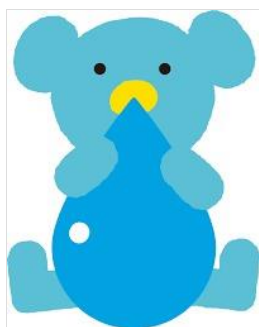
北杜市マスコット『ミズクマ』